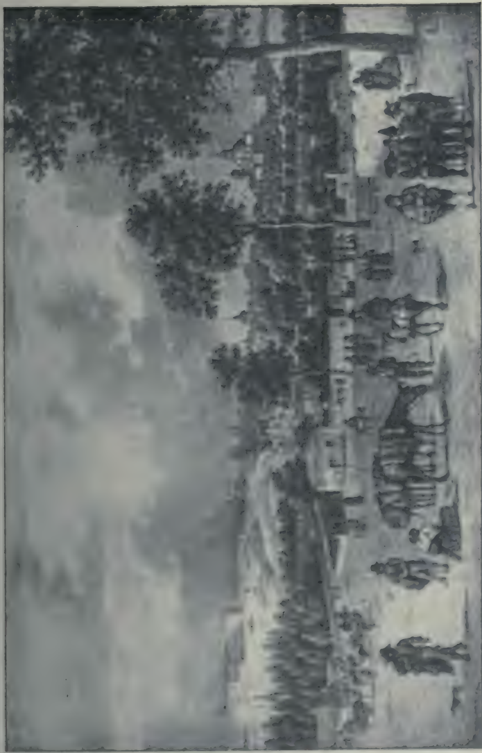
Vue de Madrid prise sur la route de Segovie. Lithographie de G. Engelmann.